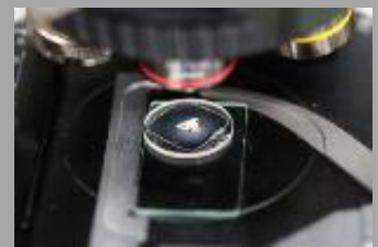
チェリャビンスク隕石と偏光顕微鏡

T. Niihara , H. Kaiden, K. Misawa, T. Sekine, T. Mikouchi. U-Pb isotopic systematics of shock-loaded and annealed baddeleyite: Implications for crystallization ages of Martian meteorite shergottites. Earth and Planetary Science Letters 341-344, 195-210. LPI contribution # 1674. T. Niihara . 2011. Uranium-lead age of baddeleyite in shergottite Roberts Massif 04261: Implications for magmatic activity on Mars. Journal of Geophysical Research , Vol. 116, E12008, 12 pp. doi:10.1029/2011JE003802. LPI contribution # 1644.