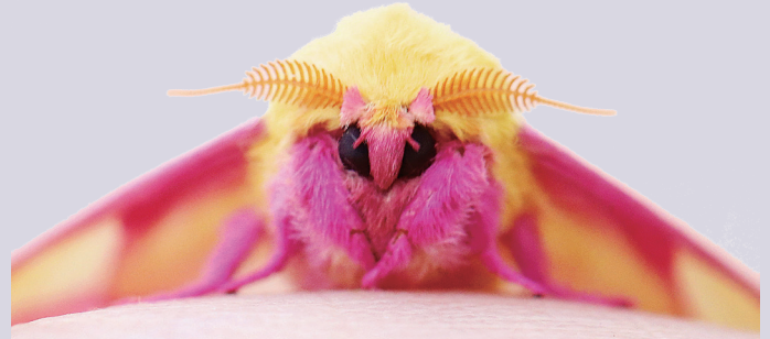
メルヘン的な色彩を放つ北米産のモイロヤマモ（ロージーメイプルモス）