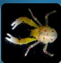
アカボシシオリエビ