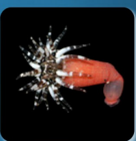
コンボウイソギンチャク