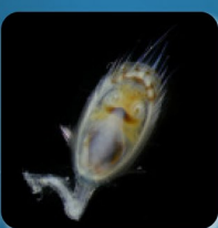
シャミセンガイ属の1種