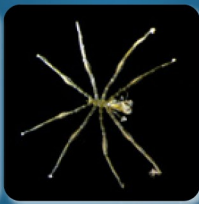
カノテウミグモ科の1種