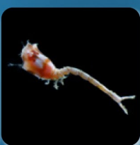
コンボウイソギンチャク