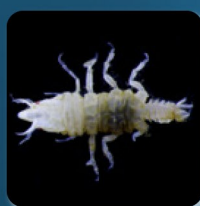
ヤマトシカイウミクワガタ