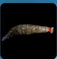
ナスビイソギンチャク