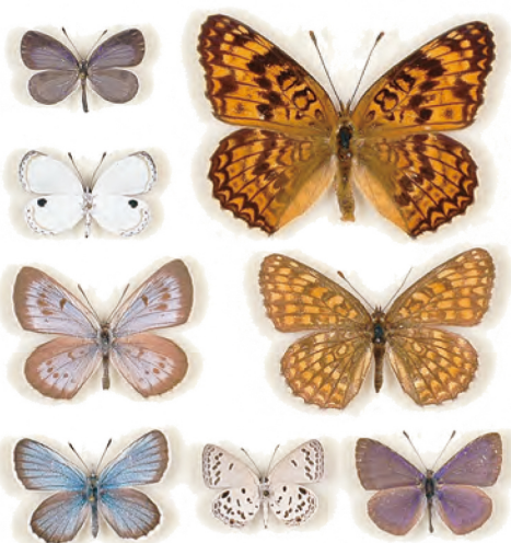
環境省「種の保存法」国内希少野生動物植物種のチョウ

昆虫とは、時に身近で親しみやすく、時に可憐で美しく、時に忌み嫌われる存在です。人の感性を揺さぶるこの生き物は、色や形、大きさ、動きが環境に合わせて実に様々です。今回の展示では、別の種どうしはもちろんのこと、同じ種の中でも何一つ全く同じ形や模様のない昆虫の多様性を体感できます。また、昆虫の多様性を生み出した進化や発生の過程、近年の生態系破壊や地球温暖化などの影響を受ける昆虫の変化も解説します。東京大学ならではの歴史的標本にも触れることで、現代の子供達に昆虫への科学的な探究心を抱いてもらえたら幸いです。