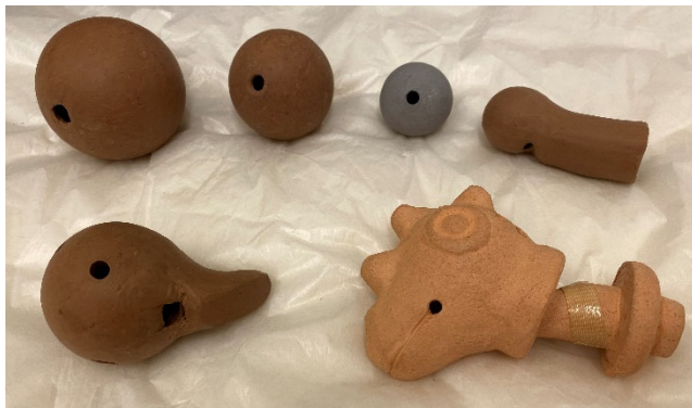
(上) 動物像付き双塔形笛吹き ボトル(BIZEN 中南米美術 館蔵)のオリジナルとレプリ カ群。(左より)オリジナル、 3D プリントレプリカ、インダ ストリアルクレイレプリカ、 土器レプリカ、3D プリント レプリカ(半裁)。